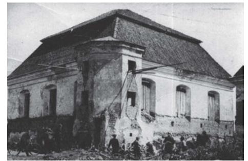
Tykocin. Bożnica z 1642 r. Fotografia z ok. 1960 r.