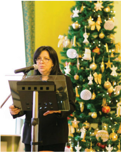
Dokończenie ze strony 1

Gra na instrumentach pasterskich jest dla uczestników formą aktywnego udziału w kulturze, angażującą do uczestnictwa całe rodziny. Międzynarodowy zasięg Konkursu podnosi jego rangę i pozwala rok rocznie zapraszać kolejnych instrumentalistów z różnych części świata.