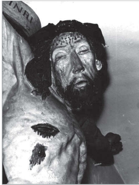
Tykocin. Klasztor bernardynów. Pasja Chrystusa z ok. 1479 r. Fot. Z. Minko.

20 października 1620 r. burmistrz, ławnicy i cały „urząd” królewskiego miasta Tykocina zatwierdzili statut cechu ślusarzy, kowali, stolarzy, rymarzy, czapników, szklarzy, kotlarzy, stelmachów i szychtarzy, co 10 XII 1620 r. zyskało aprobatę króla Zygmunta III 36 . 29 V 1659 r. król Jan Kazimierz potwierdził i odnowił dawne prawa tykocińskiego cechu szewców 37 . Inwentarz spisany po śmierci Jana Klemensa Branickiego w 1772 r. wyszczególnia w Tykocinie cechy: rzeźnicki i piekarski, młynarski, rybacki, krawiecki, wspólny szmuklerzy, czapników i kuśnierzy, wspólny kotlarski, ślusarski, mosiężniczy i stolarski, wspólny furmański i kupiecki, także wspólny szewski, garbarski i rymarski.