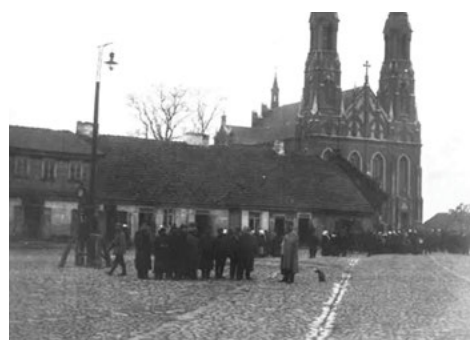
Sokoły. Rynek 1914 r.

W 1892 r. we wsi Sokoły było 28 majstrów-rzemieślników z 17 uczniami. W połowie XIX stulecia w Sokołach mieszkało 1500 osób (w tym 1380 Żydów). W 1890 r. mieszkało tam 2300, a w 1906 r. 4100 mieszkańców, w 1914 – 4200 (90% Żydów). W osadzie były 3 domy murowane i 76 drewnianych. W 1890 r. było domów murowanych 8 , sklep z wyszynkiem, szkoła początkowa, 36 kramów.