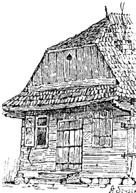
Czyżew. Dom. Rys. Szyszko-Bohusz. Początek XX w. Z. Gloger, Budownictwo drewniane , t. 1, s. 235.

Inwentarz kościoła czyżewskiego z 15 III 1739 r. wzmiankuje: Kościół drewniany, dobry, ze dwiema kaplicami sub titulo sancti Jacobi Apostoli et sanctae Annae.