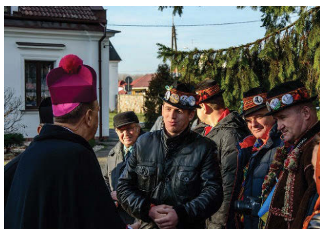
Dokończenie ze strony 1.

Uroczystość uświetniły koncerty zespołów: Pleskota z Chmielna, Karpatska Taystra z Ukrainy, Bacowskie Trio ze Słowacji oraz Pieniny z Krościenka nad Dunajcem.