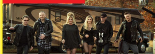
BEATA i BAJM 20:30