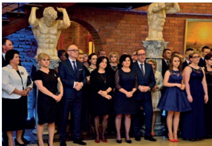
Dokończenie ze strony 1.

Wszyscy szacowni goście w ciepłych słowach zwracali się do bohaterów studniówki – czyżewskich maturzystów, życząc im niezapomnianych wrażeń z balu oraz połamania piór na maturze. Po wysłuchaniu pięknych życzeń nadszedł czas na podziękowania, kierowane do zaproszonych gości, którzy w różny sposób przyczynili się do rozwoju naszej szkoły, w tym również do wychowawców i nauczycieli za trud, opiekę i heroiczny wyczyn wpajania nam drogocennej wiedzy. Uczniowie dziękowali również