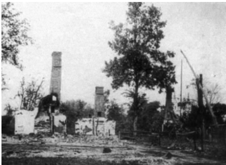
Wysokie Mazowieckie. Ruiny miasta. Fotografia 1915 r.