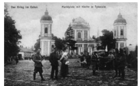
Tykocin. Rynek w 1915 r.