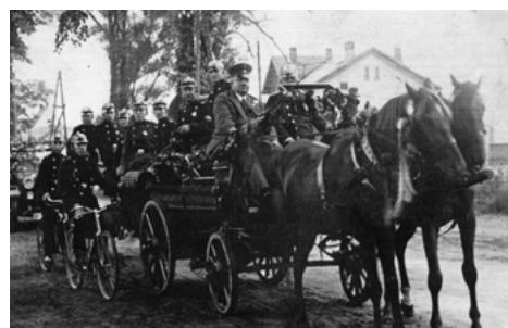
Sikawka konna z 1934 r.

5 VII 1926 r. Towarzystwo Straży Ochotniczej w Czyżewie; 6 III 1927 r. Stowarzyszenie Ochotniczej Straży Pożarnej w Rosochatem Kość; 9 III 1927 r. Towarzystwo Straży Ogniowej w Wysokim Mazowieckiem; 9 III 1927 r. Towarzystwo Straży Ogniowej w Kurowie; 19 V 1927 r. Towarzystwo Ochotniczej Straży Pożarnej w Łapach; 16 XI 1927 r. Towarzystwo Ochotniczej Straży Pożarnej w Dąbrowce Kościelnej; 12 XII 1927 r. Ochotnicza Straż Pożarna w Broku; 15 IX 1928 r. Ochotnicza Straż Pożarna w Złotorii; 27 IX 1928 r. Ochotnicza Straż Pożarna w Kuleszach Kościelnych; 27 IX 1928 r. Ochotnicza Straż Pożarna w Wojnach Szubach; 27 IX 1928 r. Ochotnicza Straż Pożarna w Gołaszech Puszczy; 20 XII 1928 r. Ochotnicza Straż Pożarna w Mystach Rzym; 4 I 1929 r. Ochotnicza Straż Pożarna w Kobylinie Borzymach; 5 I 1929 r. Ochotnicza Straż Pożarna w Pajewie; 4 II 1930 r. Ochotnicza Straż Pożarna w Kalinowie Czosnowie; 5 III 1930 r. Ochotnicza Straż Pożarna w Klukowie; 30 III 1931 r. Ochotnicza Straż Pożarna w Jabłoni Jankowiętach; 25 XI 1931 r. Ochotnicza Straż Pożarna w Truskolasach Lachach; 25 XI 1931 r. Ochotnicza Straż Pożarna w Poświętnem.