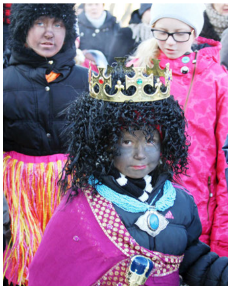
Dokończenie ze strony 1.

Po mszy, na placu Ks. K. Kluka, każda ze szkół zaprezentowała własny program artystyczny, wystąpili kołędnicy z Pobikier i śpiewano wspólnie kolędy. Rozstrzygnięty został też konkurs na najlepsze przebranie, w którym nagrody ufundowali Burmistrz Ciechanowca, proboszcz parafii pw. Trójcy Przenajświętszej w Ciechanowcu i Bank Spółdzielczy w Ciechanowcu.