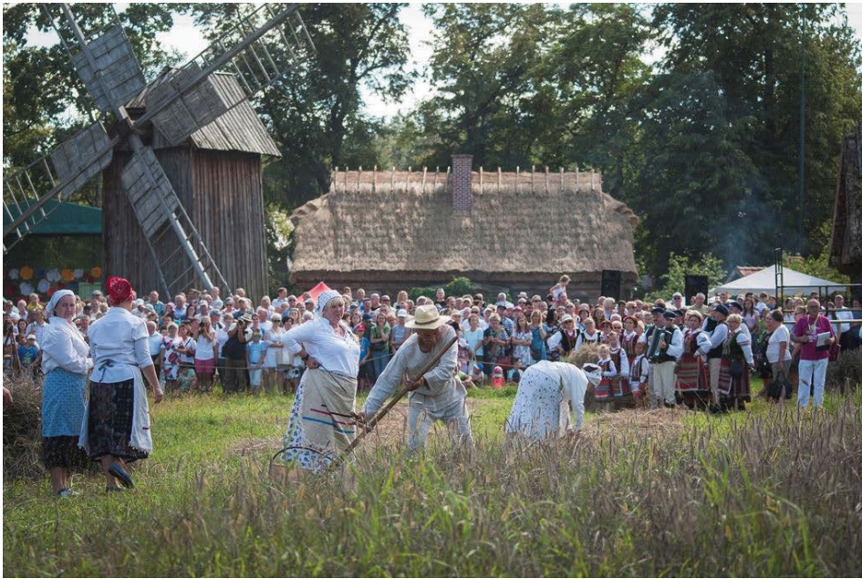
Ciąg dalszy ze strony 1.

Muzeum Rolnictwa, jako instytucja kultury o profilu zainteresowań przede wszystkim związanym z życiem na dawnej wsi podlaskiej, pracy w gospodarstwie domowym i historii rolnictwa, jest miejscem, które jak żadne inne, prezentuje te tradycje w otoczeniu żywej XIX wiecznej wsi podlaskiej. Dzięki organizowaniu tego wydarzenia, swoją działalność naukowo-badawczą prezentuje szerokiej publiczności. Ożywia tradycje, daje możliwość bezpośredniego kontaktu z historią regionu. Muzeum prezentuje i kultywuje zwyczaje w pierwotnej, nieskażonej nowoczesnością formie.