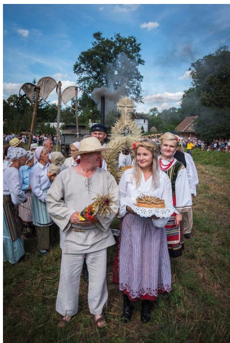
Dokończenie ze strony 10.

Na imprezę przybyło ponad 50 tysięcy turystów, którzy przez cały dzień mogli uczestniczyć w widowiskowych pokazach obrzędów oraz poczuć klimat dawnej mazowiecko-podlaskiej wsi, kupić chleb, skosztować różnorodnego jądła oraz produktów regionalnych.