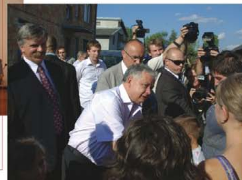
Prezydent RP Lech Kaczyński z wizytą u rodzin poszkodowanych wskutek trąby powietrznej, która przeszła nad Powiatem Wysokomazowieckim