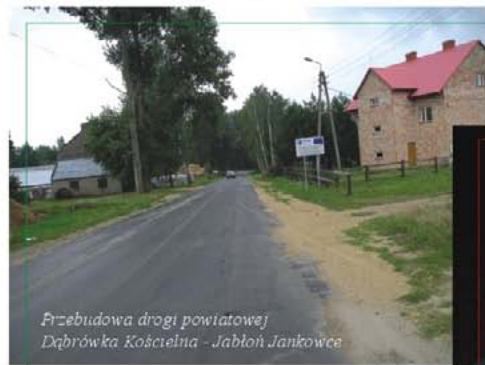
Przebudowa drogi powiatowej Dąbrowka Kościelna - Jabłoń Janówce