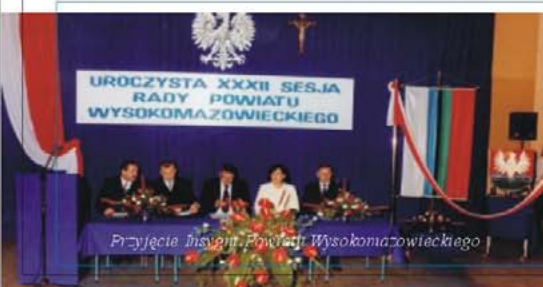
Przyjęcie Insygnii Powiatu Wysokomazowieckiego