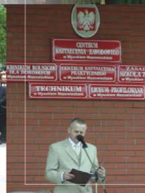
Dyrektor Centrum Kształcenia Zawodowego podczas uroczystego otwarcia szkoły