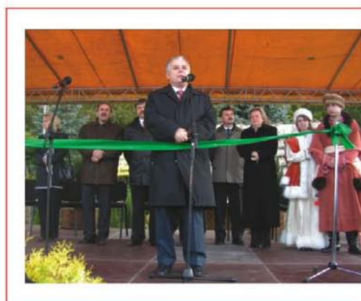
Lech Kaczyński Prezydent RP podczas otwarcia II Forum Rolniczego Województwa Podlaskiego w Szepietowie