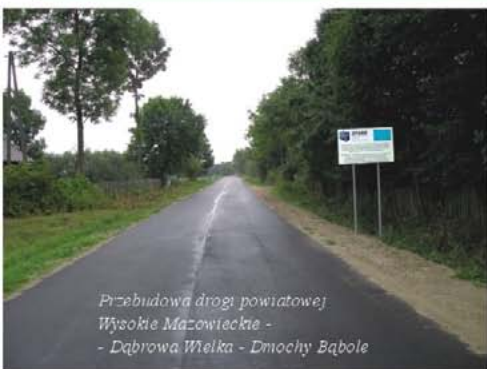
Przebudowa drogi powiatowej Wysokie Mazowieckie - Dąbrowa Wielka - Dmochy Bąbole