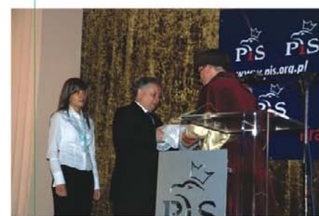
Wizyta Premiera Jarosława Kaczyńskiego w Wysokim Mazowieckim