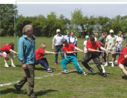
Drużyna starostwa powiatowego podczas I Powiatowej Olimpiady Samorządowej