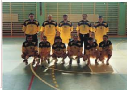
Reprezentacja Powiatu Wysokomazowieckiego podczas I Halowego Turnieju Piłki Nożnej Samorządowców Powiatu