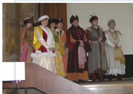
Delegacja Powiatu Wysokomazowieckiego podczas II Sesji Kongresu Mediów Regionalnych i Lokalnych w Warszawie