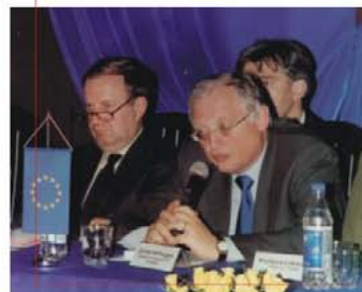
Wizyta Komisarza Unii Europejskiej Güntera Verheugena w Powiecie Wysokomazowieckim