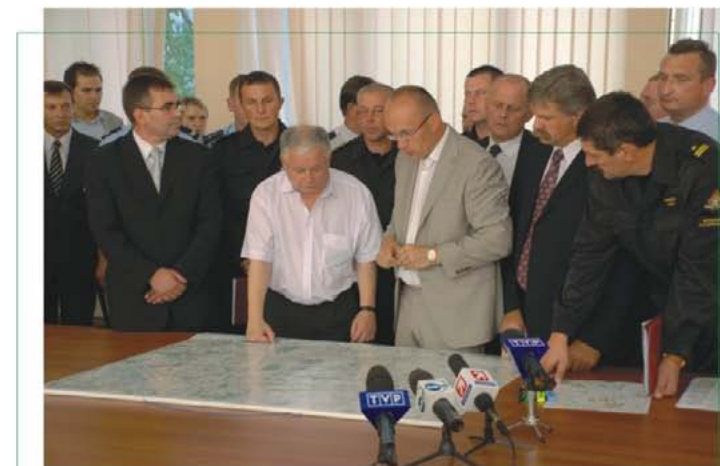
Prezydent RP Lech Kaczyński podczas wizyty w Starostwie Powiatowym w Wysokim Mazowieckim