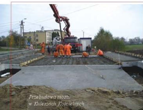
Przebudowa mostu w Kuleszki Kościelne