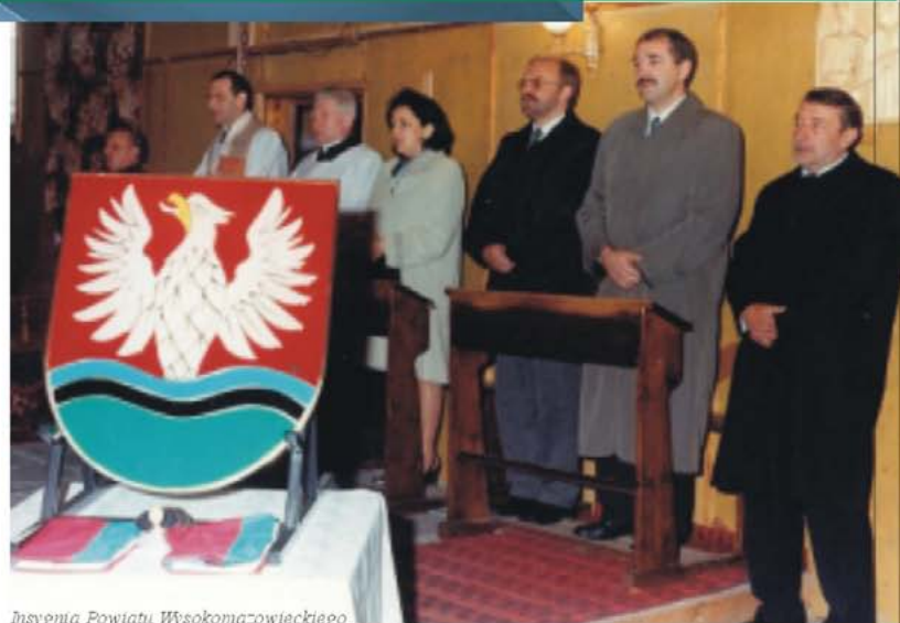
Insygnia Powiatu Wysokomazowieckiego