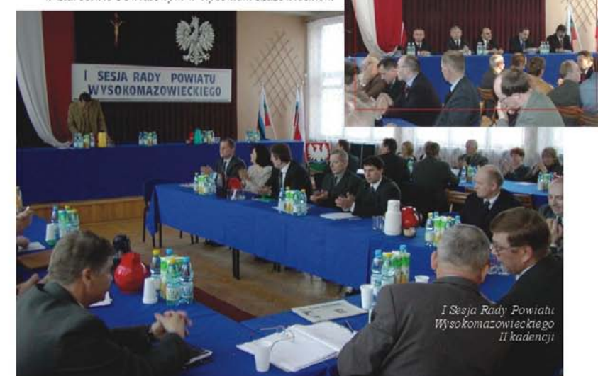
I Sesja Rady Powiatu Wysokomazowieckiego II kadencji