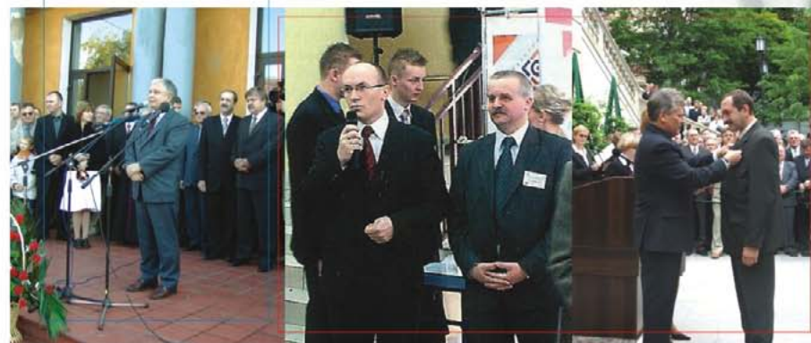
Lech Kaczyński kandydat na Prezydenta RP w Wysokim Mazowieckiem